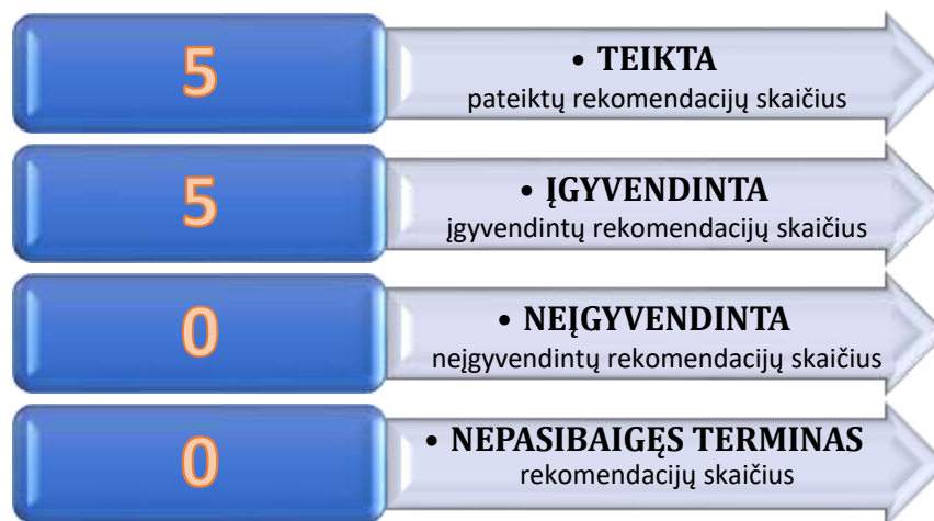
5 pav. 2020 m. balandžio 1 d. audito ataskaitoje Nr. AIS-4 pateiktų rekomendacijų įgyvendinimas

Atlikusi rekomendacijų įgyvendinimo stebėseną, Tarnyba nustatė, kad 2021 m. balandžio 9 d. įgyvendinta 100 proc. audito ataskaitoje pateiktų rekomendacijų (žr. 5 pav.)