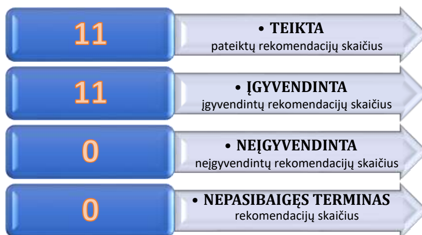
6 pav. 2020 m. birželio 16 d. audito ataskaitoje Nr. AIS-9 pateiktų rekomendacijų įgyvendinimas

Tarnyba 2020 metų pabaigoje parengė Savivaldybės 2020 metų konsoliduotųjų ataskaitų rinkinio, Savivaldybės biudžeto ir turto naudojimo audito strategiją: nustatė reikšmingas sritis, atrinko subjektus, kuriuose 2020–2021 m. bus atliktos pagrindinės audito procedūros ir kt.