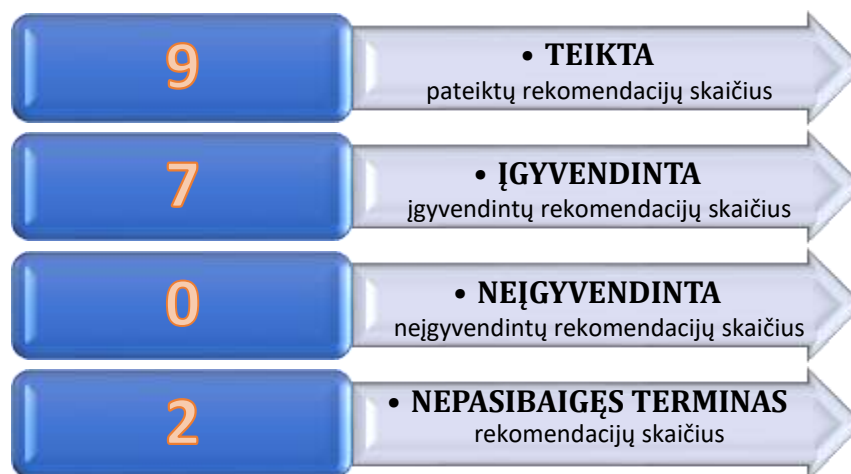
2 pav. 2020 m. liepos 15 d. audito ataskaitoje Nr. AIS-11 pateiktų rekomendacijų įgyvendinimas

Atlikusi Savivaldybės 2019 metų konsoliduotųjų ataskaitų rinkinio, Savivaldybės biudžeto ir turto naudojimo audito ataskaitoje pateiktų rekomendacijų įgyvendinimo stebėseną, Tarnyba nustatė, kad 2021 m. balandžio 9 d. buvo įgyvendinta 78 proc. pateiktų rekomendacijų (žr. 2 pav.)